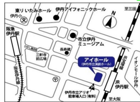
JR伊丹駅下車西側すぐ/阪急伊丹駅より東へ徒歩約10分 専用駐車場はありません。市立アリオ駐車場(有料)等をご利用ください。 自転車でお越しの際はJR伊丹駅前の市営駐輪場(有料)をご利用ください。

◇参加費は申込時にお支払いください。電話予約の場合、概ね1週間以内に伊丹スポーツセンターまたはアイホールへ支払いにお越しください。