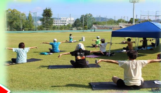
昨年度「青空ヨガ」の様子